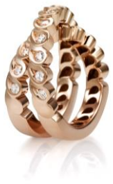
— Visione frontale