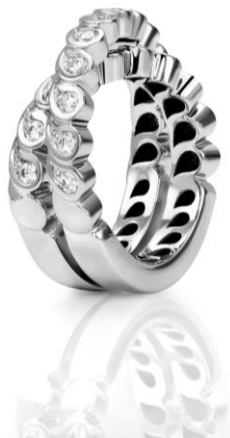
Anello in oro bianco 18 carati con diamanti 0,82 carati.

Vedi descrizione nella scheda tecnica allegata.