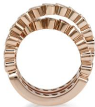
— Visione laterale